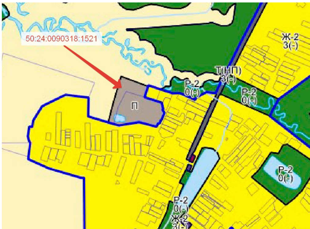
Рисунок 1 – Фрагмент карты градостроительного зонирования городского округа Подольск Московской области в части рассматриваемой территории

Для вида разрешенного использования земельного участка «50:24:0090318:1521» установлены минимальные отступы от границ земельного участка 3,0м, максимальный процент застройки объекта капитального строительства – не установлен . Фрагмент карты градостроительного зонирования Орехово-Зуевского г.о. Московской области в части рассматриваемой территории представлен на рисунке 1.